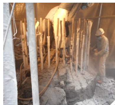
写真3 一般のハンドブレイカーによる解体状況(従来工法)