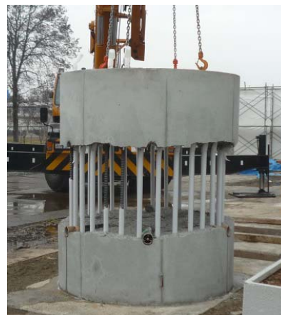
写真2 余盛撤去状況