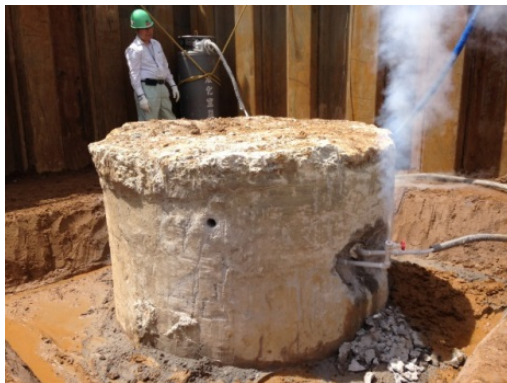
写真4 冷却状況（液体窒素：-196℃）

2015年6月に埼玉県さいたま市内の作業所に本工法を適用しました。冷却開始後約10分でひび割れが発生し、クレーンで余盛を撤去することにより、低騒音・低振動・無粉塵で杭頭処理を行うことができました。