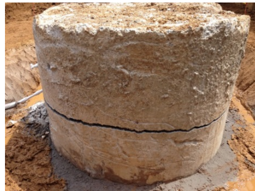
写真5 ひび割れ状況