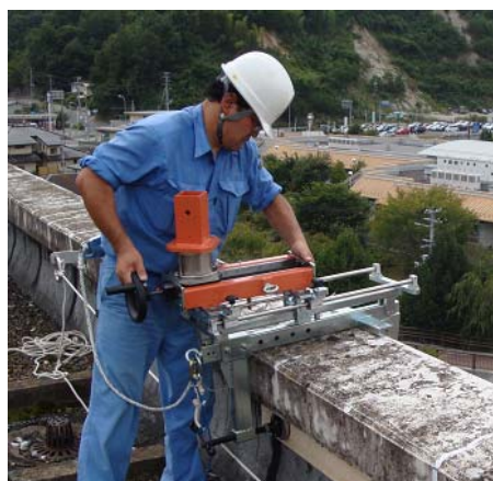
写真4 測定システム 組立て状況