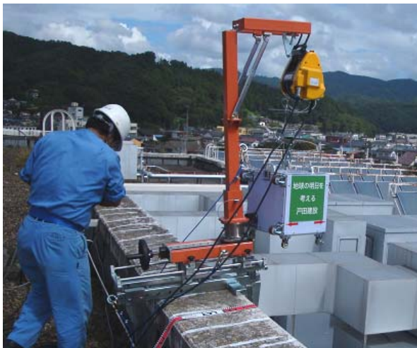
写真1 福島県内のビル屋上で測定システムをセット (全パーツを工具レスで組立)

また今回の開発により、当社が目指していたトータル除染システムも確立しました。今後は除染の企画・調査から除染作業、放射性物質の拡散防止、放射性廃棄物管理まで当社独自のソリューションをワンストップで提供していきます。