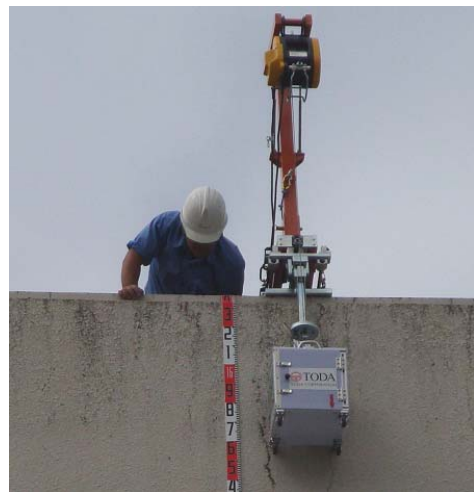
写真2 電動昇降し、自動測定する「さー兵衛」