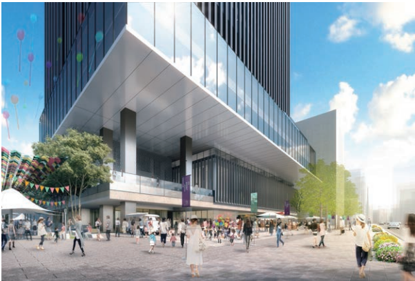
新TODAビル 北西側イメージパース

戸田建設が事業主となり開発する新TODAビルの低層部には、誰もが気軽に芸術・文化を体感できる「ミュージアム・ギャラリー」、若手芸術家の創作活動を支援する「創作・交流施設」、芸術作品の展示やイベントを開催する「情報発信施設」といった文化貢献施設を開設します。併せて地上部分には文化イベントや地域活動を展開する広場（仮称・アートスクエア）を整備します。