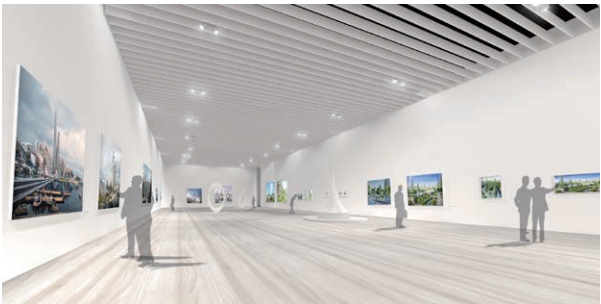
ミュージアム 展示室イメージパース

従来の美術展とは一線を画すクリエイティブなコンテンツを専門的に扱う施設を目指しています。具体的な分野としては、音楽、映画、アニメ、建築、現代アートなどを想定しており、豊富なコンテンツを有するソニーミュージックグループを核として、新聞社やテレビ局、広告代理店、出版社等と協力して、話題性と集客力に富んだ展覧会を開催します。