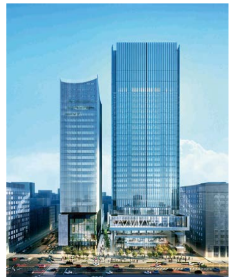
街区の完成予想パース ©日建設計