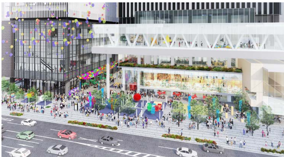
グランドオープン時（2024年）の京橋彩区のイメージ

当計画の第一段階として2019年7月、永坂産業が街区北側で建築中の「ミュージアムタワー京橋」が先行オープンします。これに合わせて、永坂産業と戸田建設の両社は当街区の文化貢献施設部分の名称を「京橋彩区」（きょうばし さいく）と決定するとともに、当街区を新しい「まちに開かれた芸術・文化拠点」として運営、発展させるための組織として、本年4月1日付で「一般社団法人 京橋彩区エリアマネジメント」を発足します。