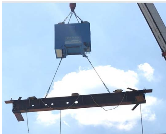
写真1 吊荷旋回制御装置の現場適用状況

※2 質量が慣性をもつために現れる見かけの力のこと。なお、慣性とは「止まっているものは止まりつづけ、等速度で動いているものは等速度で動き続けようとする性質」のこと。