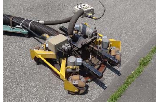
写真2 バキュームブラストロボットシステム