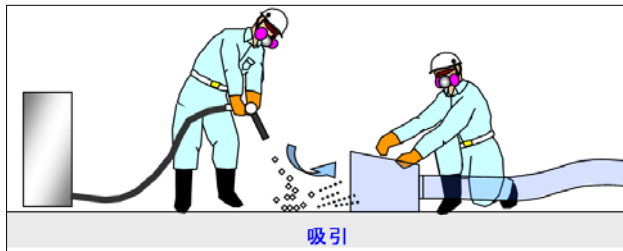
図2 ワイドバキューム工法イメージ