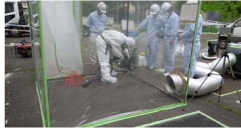
写真4 塗布乾燥後、隔離養生して除染