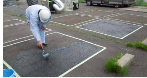
写真3 除染対象面にゲル化剤を塗布